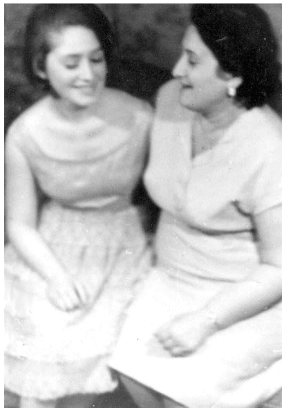
Mother and daughter. 1964